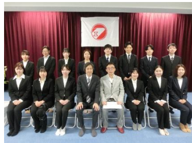
理事長と令和7年度 新規採用職員

就職説明会・職場見学会のお知らせ 随時実施しております。お気軽にお問い合わせください