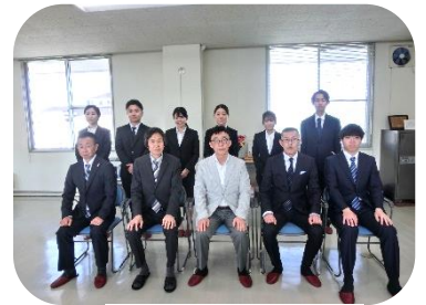
理事長と令和6年度新規採用職員

就職説明会・職場見学会のお知らせ 随時実施しております。お気軽にお問い合わせください