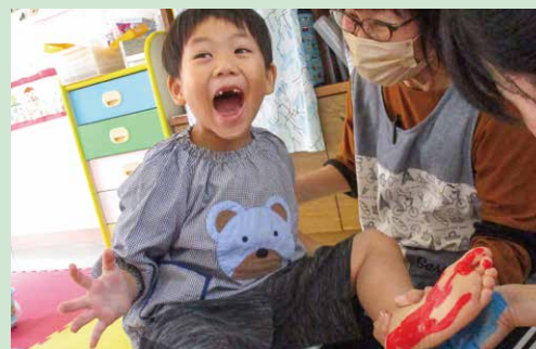
つぼみ保育室 足に絵の具ペタペタ！くすぐったいよ～！！