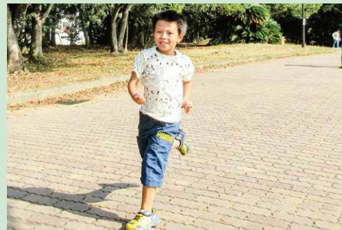
マラソンクラブ タイムトライアル、新記録でるかな？