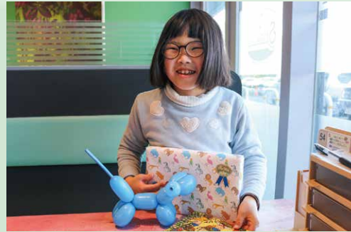
お誕生日外出 プレゼントもらったよ、うれしいな♪