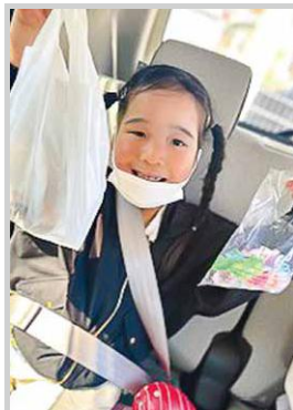
いっぱいもらったよ！