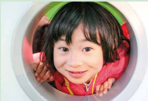
アンパンマンミュージアムでの1枚 アンパンマンに会えて満足気な笑顔♡