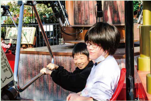
レゴランドでのアトラクション！ ハラハラ、ドキドキ 楽しかったよ♪