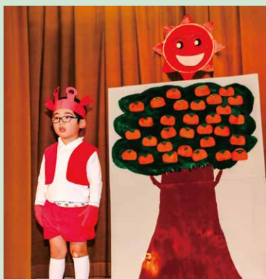
お遊戯会 ちよつと緊張したけど がんばりました！