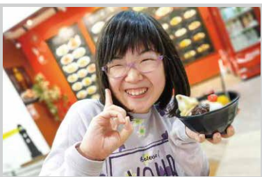
スイーツ大好き♡ あんみつ片手にハイポーズ♪