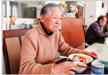
毎日の食事は楽しみです