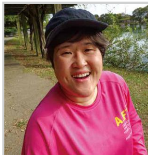
天気の良い日は、 楽しく歩いています！