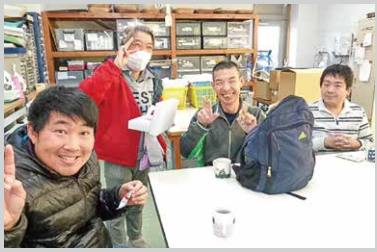
仲間といっしょに作業後の コーヒータイムでぼっと一息