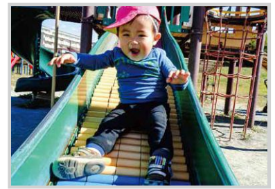
すべり台、たのしい！