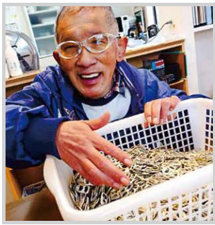
白内障手術に成功して大好きな フルタブ遊びを楽しめます