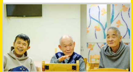
笑顔が健康の秘訣です