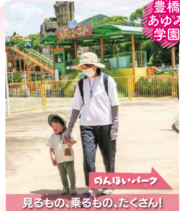
豊橋 あゆみ 学園