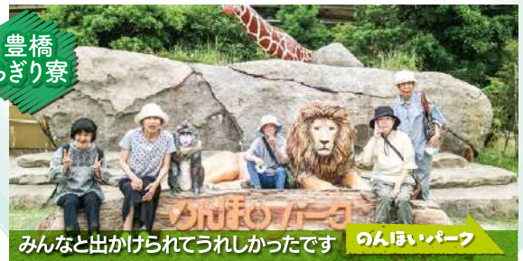
みんなと出かけられてうれしかったです