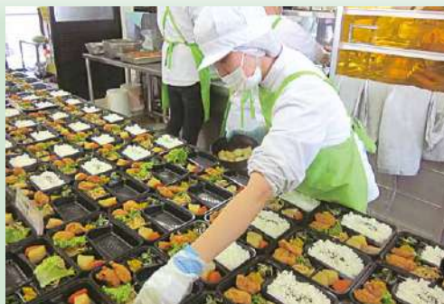
弁当作業 (就労継続支援B型事業) 毎日180食ほどのお弁当をつくっています