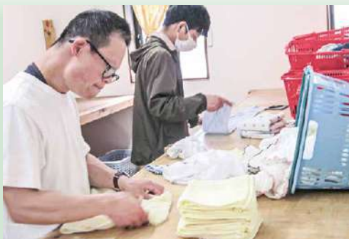
洗濯作業 (就労継続支援B型事業) 豊橋ちぎり寮の洗濯作業をおこなっています