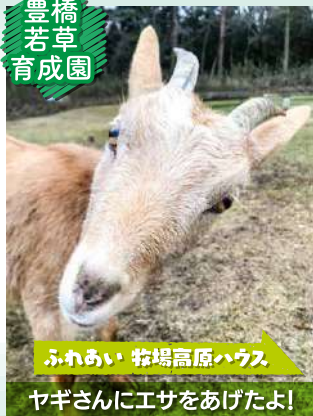
ふれあい 牧場高原ハウス