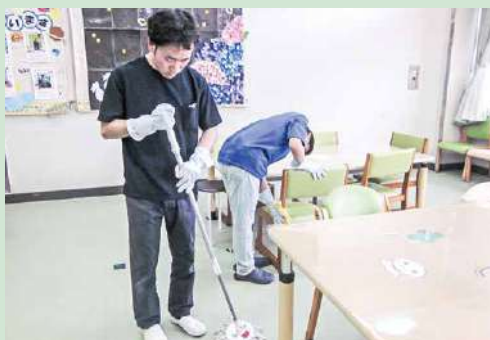
清掃作業 (就労継続支援B型事業) 豊橋ちぎり寮の食堂掃除をしています