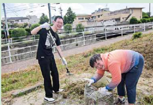
除草作業 (生活介護事業) 法人の駐車場の除草作業をしています