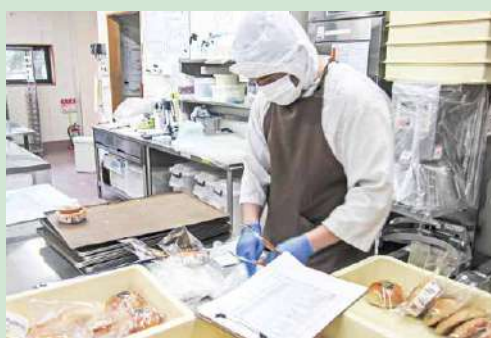
製パン作業 (就労継続支援A型事業) 企業様への委託販売のため、パンを袋詰めしています

「一生けん命がじまんです」をモットーに、 各作業班において毎日作業をがんばっています ワークス岩西