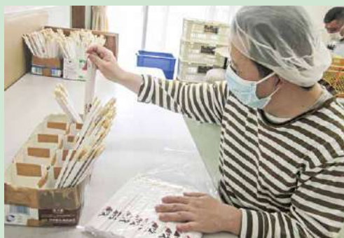
委託作業 (生活介護事業) 割り箸の袋詰めのため、箸の本数を数えています