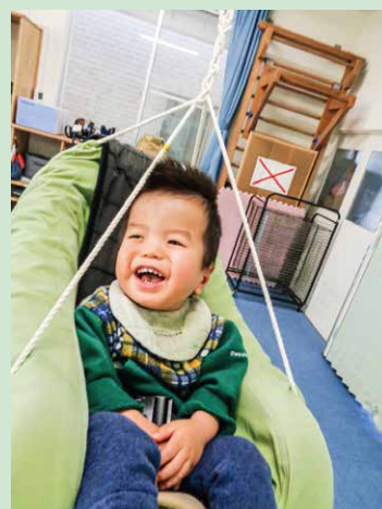
「大型ブランコ」 い〜ち!に〜い!!さ〜ん!!!