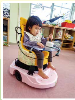
～豊橋あゆみ学園～ 24時間テレビ様 Baby Loco 小児用電動支援機器