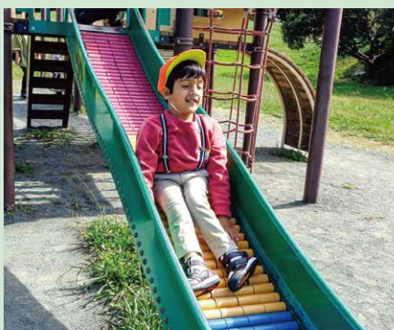
「お散歩」 幸公園へいったよ! すべり台楽しいな!