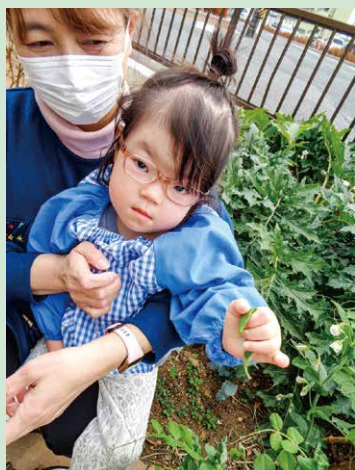
「あゆみ農園」 エンドウを収穫したよ!