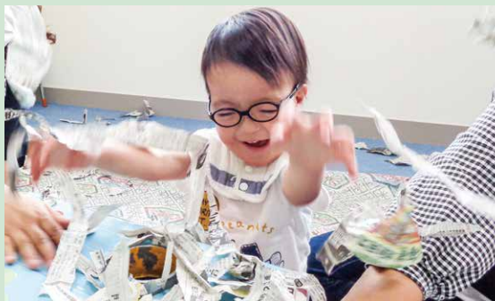
「新聞紙あそび」 びりびりびり! いっぱい ちぎったよ!!