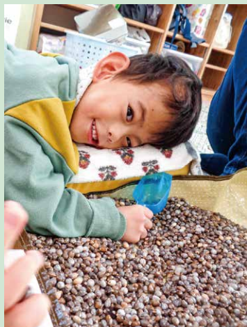
「じゅず玉あそび」 じゃらじゃら♪いい音だな〜♪