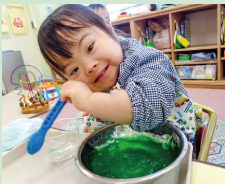
「感触あそび」 スライムあそび! 不思議な感触で おもしろいね!

笑顔いっぱいの豊橋あゆみ学園 子どもたちも保護者さんも先生も! みんなで笑って楽しく療育をしています