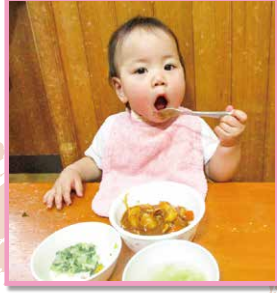
おいしい!カレーライス 大きなおうちであ〜ん!