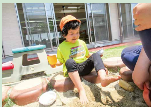
お砂の感触、とっても気持ちいいよ~♪