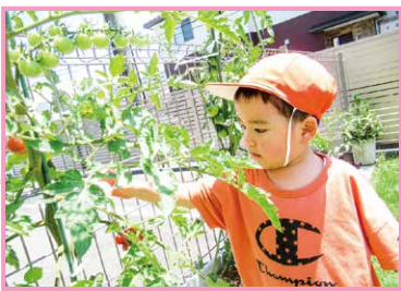
トマト大好き♡ 僕のお弁当の定番!