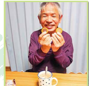
コーヒーにあわせて♪ ひとつの小袋に2種類の味が入っているクッキーがお気に入りです