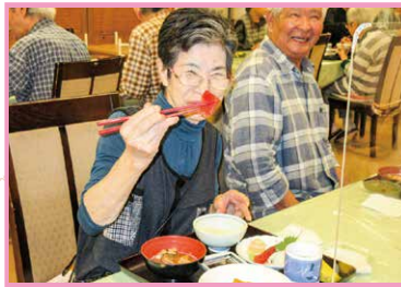
楽しい宴 誕生日メニューのお刺身、みなさん大好きです!