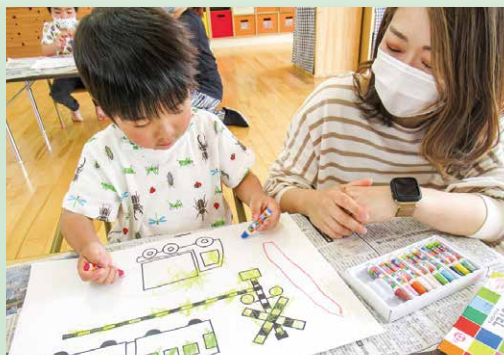
かん かん かん ふみきり、じょうずに塗ったよ!