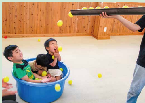
ボールがころころころ… 降ってきた!