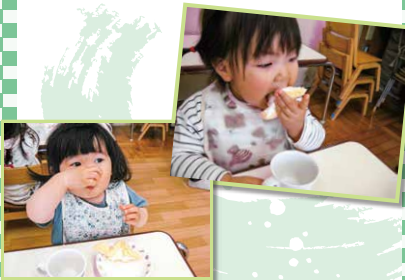
もぐもぐ、おいしい! 誕生日の日に食べるケーキが特別でうれしい!