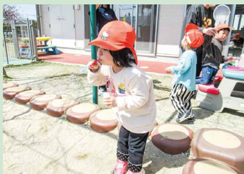
しゃぼん玉、ふう~、いっぱい出たよ!