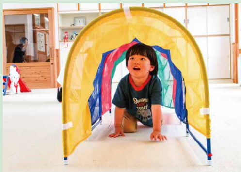
カラフルなトンネル、きれいだなあ♪