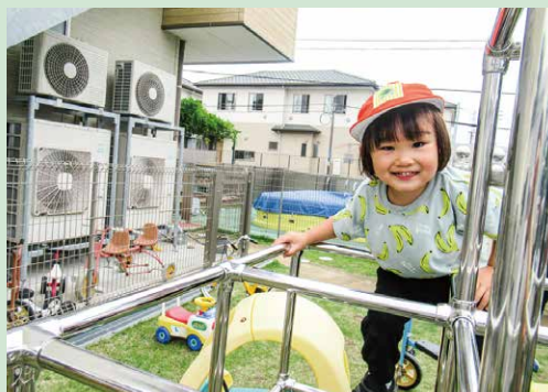
ジャングルジムのぼったよ! 高いよ~!