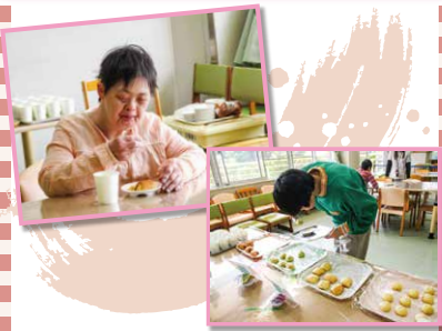
パンが大好き! パン屋さん風を選ぶのも楽しいです!