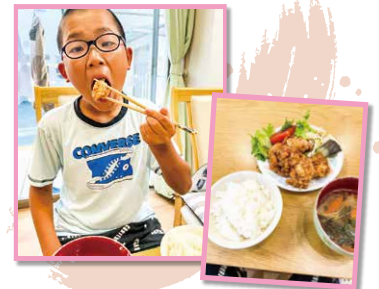
唐揚げおいし〜い! みんな大好きです!