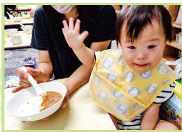
大好きなカレーライス いっぱい食べたよ!