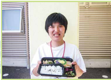
元気の源!デリランチ弁当! 大好きなお肉を食べて毎日がんばっています!