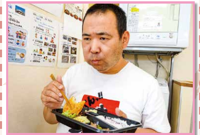
お弁当 作業後のお弁当はとてもおいしいです!