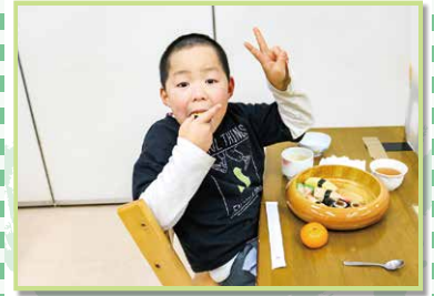
ぼくの好きな食べ物♪ 玉子のお寿司が大好きです!