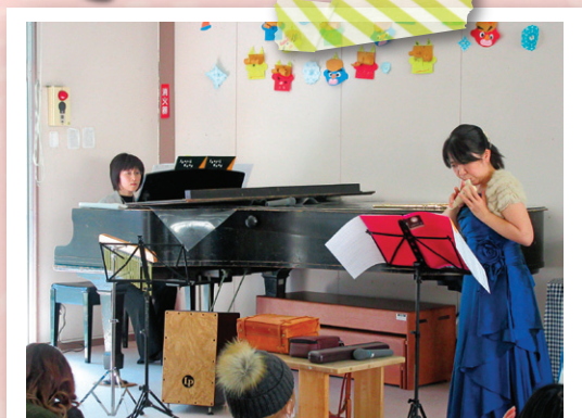
ピアノ&フルートコンサート 楽器の音色の良さを教えてくださいました