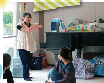
ふれあい体操 & リトミック