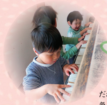
だれもがピアニストの 気分になりました。

園舎建替えに伴い、 解体することになりました。 それぞれ他のピアノたちに 生まれ変わり、これからも 多くのピアノの一部として 生き続けます。