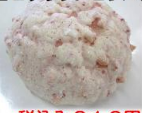
ミルク&いちご チョコチップメロンパン