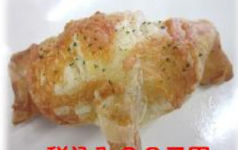
柚子胡椒チキン クロワッサン