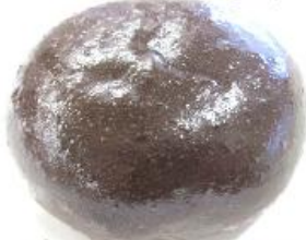
コーヒーあんぱん