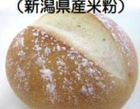
米粉のパン (新潟県産米粉)