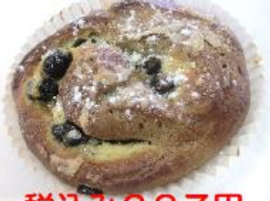
ほうじ茶黒豆 ロールパン