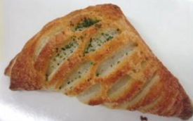
ブルコギ風味デニッシュ 税込み194円

シナモン、ジンジャー、カルダモン、ナツメグを生地に混ぜ、カスタードクリームとレーズンを巻き込みました。