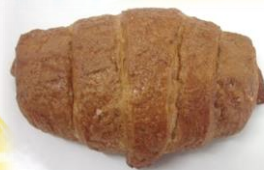
塩キャラメルクロワッサン 税込み194円