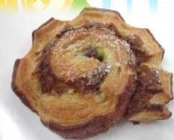
スパイスクッキーデニッシュ 税込み194円

シナモン、ジンジャー、カルダモン、ナツメグを生地に混ぜ、カスタードクリームとレーズンを巻き込みました。