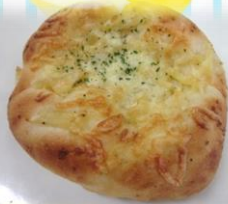
じゃがいもタルタルソースパン 税込み194円