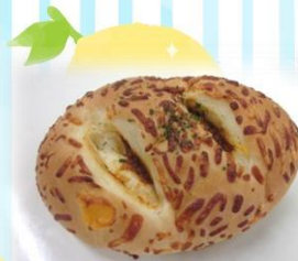
ピリ辛タコスミートパン 税込み183円