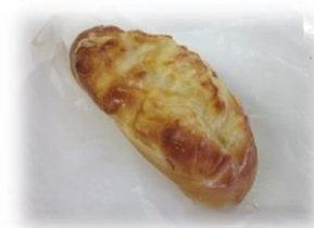
菜の花入り卵とハムのパン 税込み194円