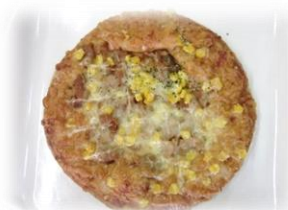
照り焼きチキンピザ 税込み194円