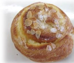
クリームチーズロール 税込み194円