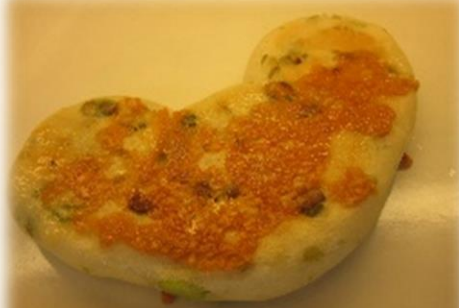
枝豆チーズパン 税抜き150円