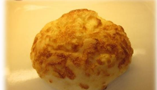
チーズドーム 税抜き110円