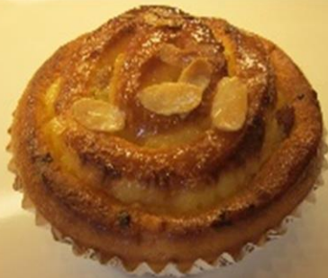
レーズン&バターのブリオッシュ 税抜き150円