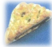
グラタンコロッセパン 150円+税