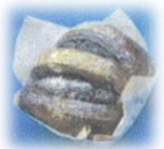
ショコラブレッド 150円+税