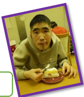
クリスマスケーキ🍰