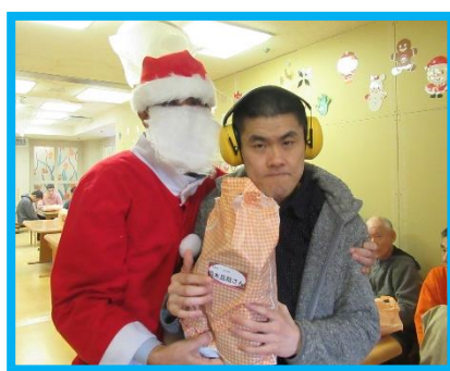
寮長サンタからプレゼント🎁