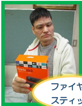
ファイヤースティック

年末に、公益財団法人豊橋善意銀行様のご厚意で、ファイヤースティック、運動器具、ドライヤー等をいただきました。「サンタさんからのプレゼントですよ」と利用者さんに手渡すと、笑顔で受け取っていました。